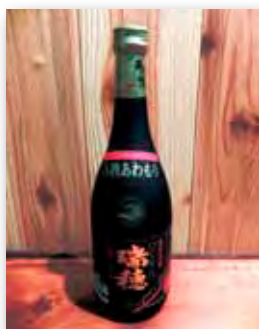
みさほ ロイヤル瑞穂 7年古酒 43度

沖縄一上質な水を使用し、水に対するこだわりが深く感じられる。バニラのような個性的な香りに人気があり、ストレートで味わってほしい。