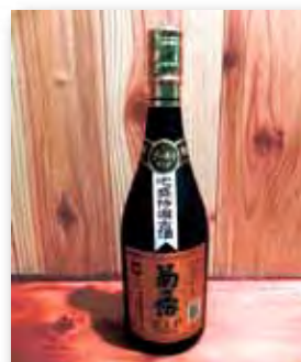
菊之露VIP 8年古酒 30度