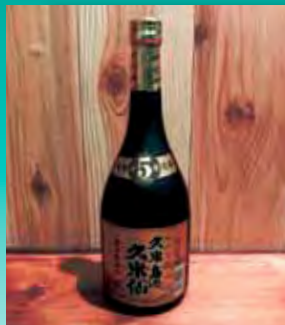
久米島の久米仙 ブラック 5年古酒 40度