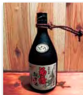
菊之露 親方の酒 25度