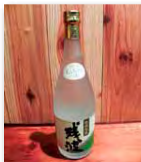
残波 ホワイト 25度