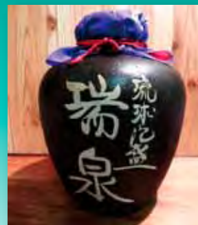
瑞泉 壺古酒 25度

奥深いコク、芳醇な香りと、円熟した上品なうまさ。古酒の魅力がたっぷり楽しめるお得なタイプ。