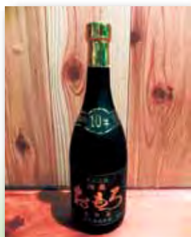
瑞泉 おもろ 十年カメ貯蔵 43度

文字どおり贅を尽くしたVIP級の泡盛。上品で繊細な飲み口はロックで飲むのがおすすめ。