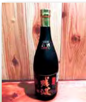
ざんば 残波 ブラック 43度

深いコクとまろやかな味わいで、じっくり熟成された古酒ならではの芳醇な香りとふつと広がる風味が特徴。