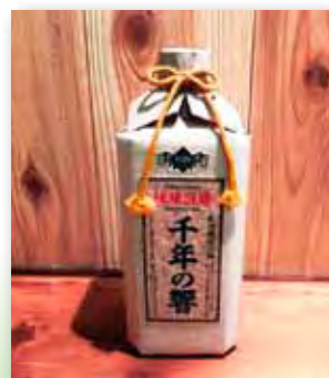
千年の響 10年古酒 25度