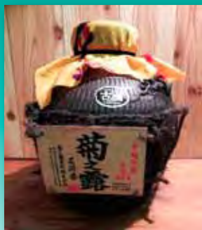
菊之露 壺古酒 40度