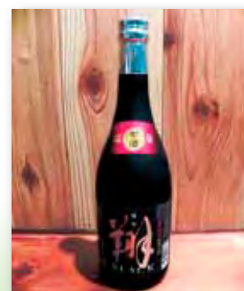
翔 ブラック 25