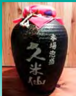
久米仙 壺古酒 35度