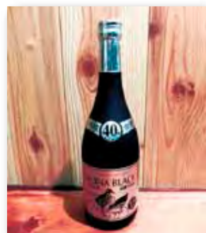
やんばる 山原くいな ブラックシルバー 5年古酒 40度