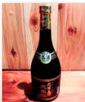
久米島の久米仙 ブラック 30度